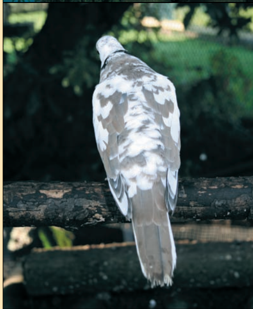
Wildkleur bont. Mooie kleurverdeling. Jammer van de witte toppen op enige dekveren. Bij bont moeten de afzonderlijke veren éénkleurig zijn: of gekleurd of wit maar niet half om half. Wat weinig kleur op de kop, maar bij bont zijn de koppen vrijwel altijd overwegend wit.