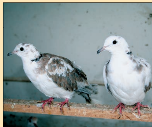
Wildkleur bont. Links zijvederig, jonge vogel die nog niet volledig is uitgeruid (zie slagpennen), dus de kleurverdeling is nog niet definitief. Rechts gladveer, door de stand van de vogel is er weinig te zeggen over de kleurverdeling, maar het lijkt dat deze vogel te wit is.

een symmetrisch getekend bonte (tekening).