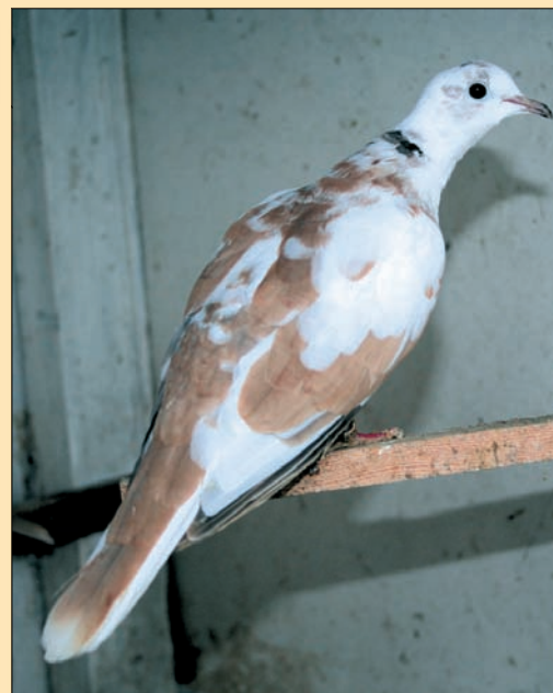
Wildkleur isabel bont. Geen mooie kleurverdeling. Vooral op vleugels en kop meer kleur gewenst en op stuit meer wit gewenst.