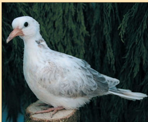
Wildkleur bont, jong in jeugdkleed. In het jeugdkleed zijn bonte lachduiven altijd schimmelkleurig. Na de eerste rui in het volwassen kleed verschijnt het oorspronkelijke bontpatroon. In dit stadium kan men nog niets zeggen over de toekomstige kleurverdeling.

Californian (zie grote tekening en kleine tekening met kuiken met ei op blz 393)