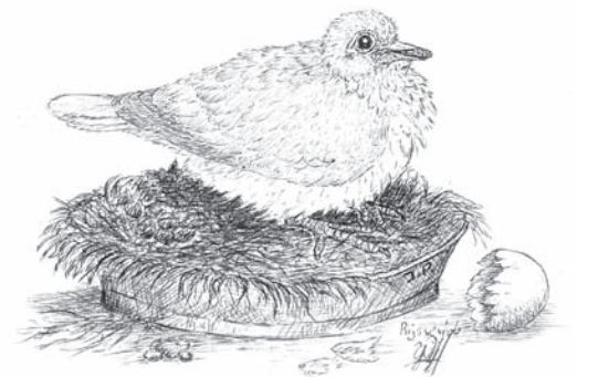
Kuiken Californian getekend bont. Het bontpatroon is nu al goed te zien.

ziet is niet zo belangrijk als de verhoudingen witkleur maar evenredig zijn. U begrijpt wel dat twee gekleurde pennen links b.v. storen met witte pennen rechts. Het is ook belangrijk dat de kleurvelden of witte velden niet al te groot aaneengesloten zijn. Dit is zgn. platerig. De witte en gekleurde velden moeten elkaar zo regelmatig mogelijk aflossen. Het hoeft beslist geen zgn. tijgertekening of dambord patroon te zijn. Grote platen zijn niet gewenst. Elke variatie is dus toegestaan wanneer ze maar symmetrisch zijn. Dus nogmaals binnen de 40-60% marge blijven en niet platerig zijn.