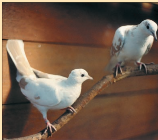
Pastel-bont met een slechte tekening, te veel wit.

Getekend (symmetrisch bont, zie tekening) Dit is een variatie die we steeds vaker tegenkomen. Let wel, deze variatie is gelijk aan de normale symmetrisch bonte en niet te verwarren met de getekend bonte, de Californian (zie tekening groot met kuiken). De symmetrisch bont getekende wordt