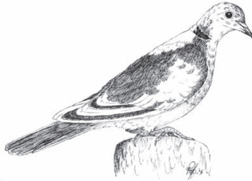
Wildkleur bont. Te platerig.

Het gaat hier om zgn. symmetrisch bonte. Bij deze bontvariëaties is het de bedoeling dat de kleur minstens evengoed is als van de éénkleurige of zelfs nog iets beter, zodat de verschillen per kleurslag duidelijk waar te nemen zijn. Het verschil tussen een wildkleur en een pastel is al groot, dit moet dus ook zo zijn bij de bonte. Heel veel bonte vertonen matige tot slechte kleuren. Hier is helaas niet of nauwelijks aan gewerkt. Zelfs van enig kleurverschil tussen een wildkleur-bont en pastel-bont is vaak nauwelijks sprake. Wildkleuren die zo bleek van kleur zijn dat er zich al grijze veren vormen. Fokkers, let op uw zaak.