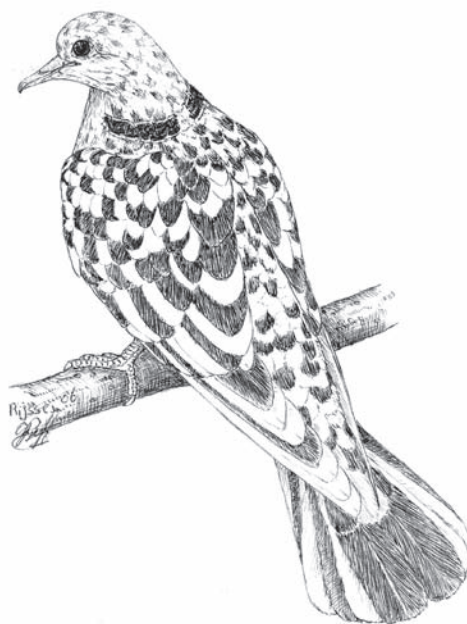
Wildkleur, symmetrisch bont, tijgertekening.

Zeer streng selecteren op kleur. Het zal u verbazen hoeveel bijna gelijk-getekende duiven er in het