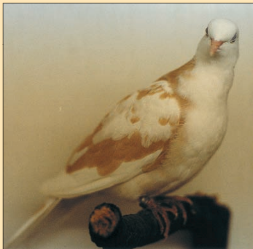
Wildkleur, isabel bont.

op toeval kunnen berusten. Ook bij deze variatie komen we witpennen, witstaarten, kleurstaarten, kleurkoppen en witkoppen of zelfs combinaties (mengelingen) van dit laatste tegen. Dus geen vast patroon, al zal de kleur hier ruim de overhand hebben (zie tekening).