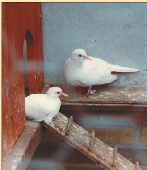
Het bekende 'witte' duifje, crème ino. 30 jaar geleden.

De symmetrisch bonten worden als schimmel geboren (zie tekening) en pas na de eerste rui zal het bontpatroon tot uiting komen. Alle bonten hebben een donker, zgn. kleurloos oog. Door de bonte variatie te selecteren op kleinere kleurvelden, dus op een grotere hoeveelheid wit, ontstaat de witte zwartoog. Makkelijker gezegd dan gedaan, want het