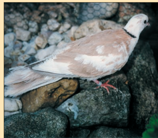
Pastel-bont, zijdevederig.

net als de gewone bonte met een schimmelkleur geboren en heeft direct betrekking op de bevedering. Alleen heeft hier een andere selectieprocedure plaatsgevonden. Een nog strengere selectie op de gekleurde delen. Ook binnen deze sectie zien we verschillende variëteiten, maar ze hebben wel gemeen dat het kleurpatroon overheerst. De meeste kleur bevindt zich op de bovenzijde en de mantel. Op de mantel bevinden zich ook regelmatig zgn. rozetten. Dit is wel typisch omdat er bij de symmetrisch bonte op dezelfde plek vaak veel wit zit. Dit zou dus een plek kunnen zijn waar zich kleur moeilijk vast wil zetten. Dit is dus geen wet, het zou