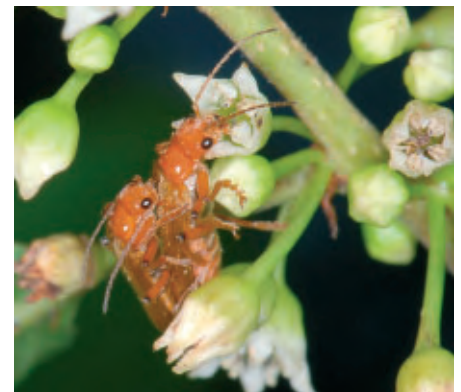
7 De vrouwtjessoldaat snoept pollen, terwijl haar partner meer in haar geïnteresseerd is.