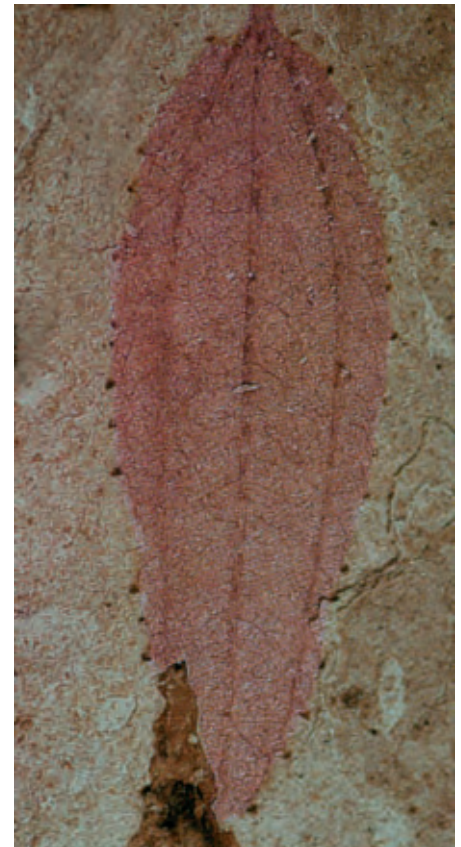
1 Versteend blad van een 35 miljoen jaren oude Wegedoorn struik.

as over; daarom is het zeer geschikt om er houtschool van te maken. Vroeger werd deze weer vermalen en gebruikt als buskruid of als teken- en schildergereedschap.