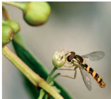
6 De zweefvlieg bijt het pollen van de helmknoppen af.