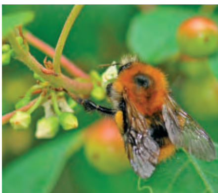
5 Deze aardhommel doet zich tegoed aan nectar en pollen.

Sporkehout tenslotte is een belangrijke voedselplant voor verscheidene diersoorten. Pollen en nectar dienen bijen, hommels en vlinders; vogels smullen intens van de talrijke bessen en zorgen ervoor, dat je in de wijde omtrek de jonge plantjes ziet opkomen.