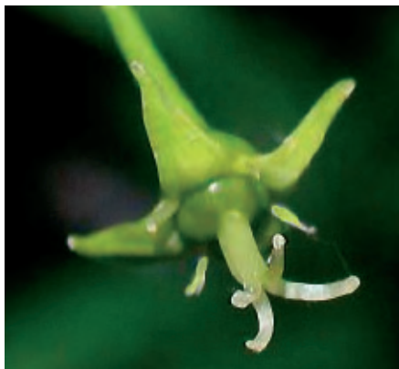
3 Bij de vrouwelijke bloem van Wegedoorn ontbreken de kroonblaadjes; de stempel is vierlobbig; de meeldraden zijn rudimentair en leveren geen pollen.