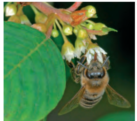
4 Met een ruim nectaraanbod lokt de plant veel bijen naar zich toe.