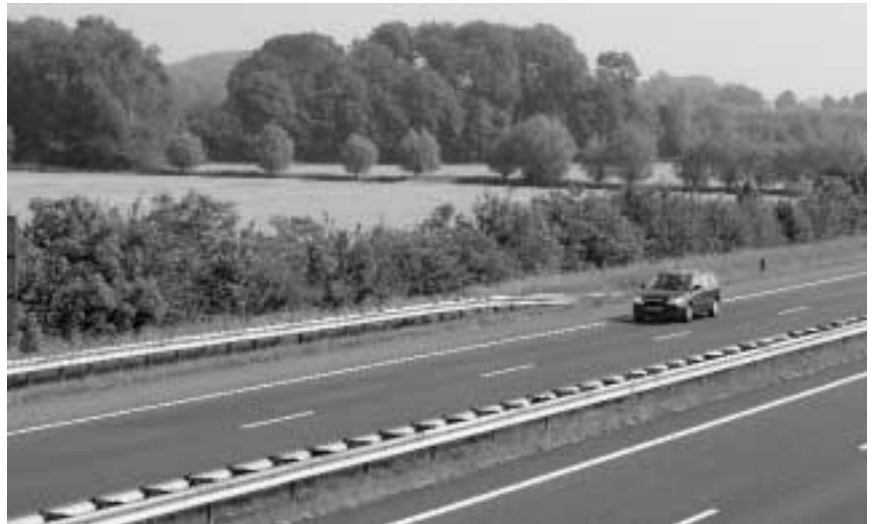
Je hebt zelf gezien hoe groot de barrières hier zijn, met name de wegen

“Uitleggen, toelichten, luisteren en kijken of je het probleem van iemand kunt agenderen. Vaak zijn er toch nog wel subsidie-mogelijkheden waar je mensen op kunt wijzen. Onlangs moesten boeren aanvraag indienen voor de Brusselse inkomstenstoeslagen. Soms zijn ze het niet eens met de basis voor de vergoedingen, ze krijgen hun formulieren niet of er zijn fouten gemaakt. Dan komen wij dat vaak in het veld tegen. Die signalen geven we door aan de Dienst Regelingen en ook aan de Directeur Gene-