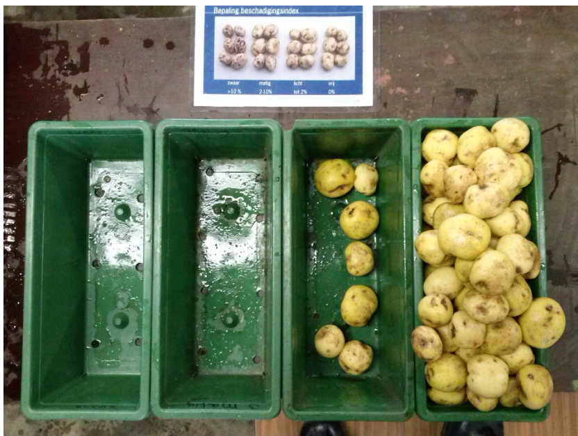
Foto 1. Bepaling beschadigingsindex.

De beschadigingsindex varieerde van (2) tot (74), waarbij praktisch alle knollen zijn beschadigd. Het gemiddelde van alle partijen was (18). Dit lage gemiddelde is een resultaat van heel veel partijen met een zeer geringe laag percentage onderhuids beschadigde knollen.