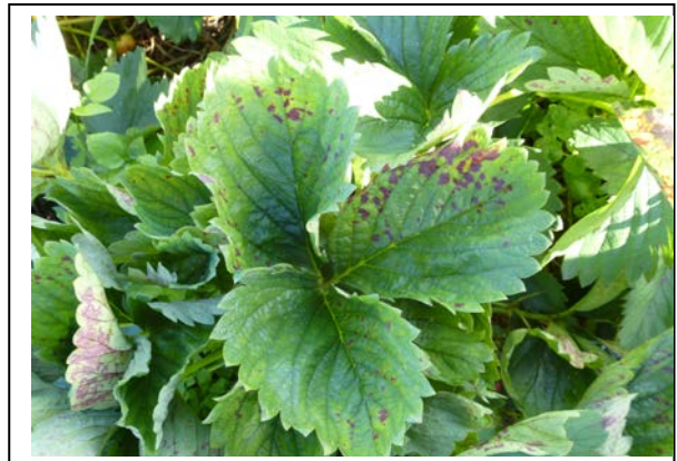
Meeldauw in onbehandelde controle