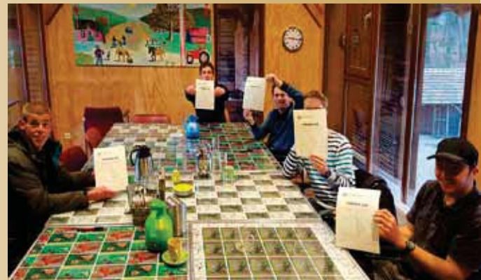
Certificaat groenmodule snoeien.

“Sommige zorgboeren hebben de schotten tussen onderwijs en zorg doorbroken.”