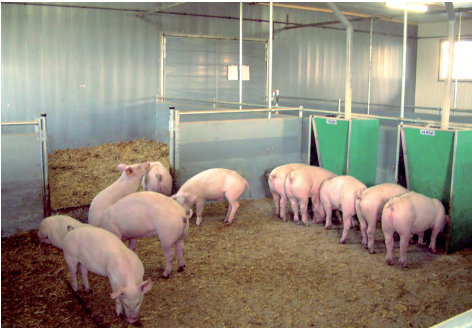
‘Borgen en zeugen gescheiden huisvesten en borgen beperkt voeren of een voer geven dat de voeropname remt, verbetert de bedrijfsresultaten.’

meeste varkenshouders die aangeven dat “een big met een slechte start nooit een goed vleesvarken kan worden”.