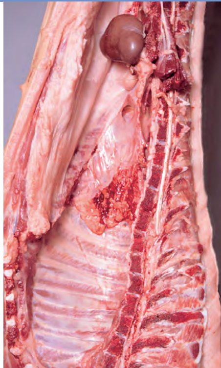
'Bedrijven die bij het spenen biggen van meer dan twee tomen samenvoegen, hebben meer varkens met pleuritis en aangetaste levers of longen.'

Vooraf de eerste dagen na de geboorte vinden de varkenshouders de Piétrain-kruisingen 'zorgenkindjes' en is extra zorg en aandacht nodig.