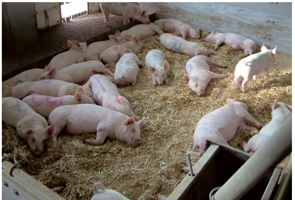
Om te voorkomen dat meer dan twee tomen moeten worden samengevoegd hebben hokken waarin 20 tot 30 biggen gehuisvest kunnen worden de voorkeur

vragenlijst ingevuld en is een rondgang gemaakt over het bedrijf. Ook zijn de productieresultaten over 2004 en 2005 verzameld (zie tabel 1). De technische resultaten waren op tien bedrijven beschikbaar, de slachtgegevens op achttien bedrijven.