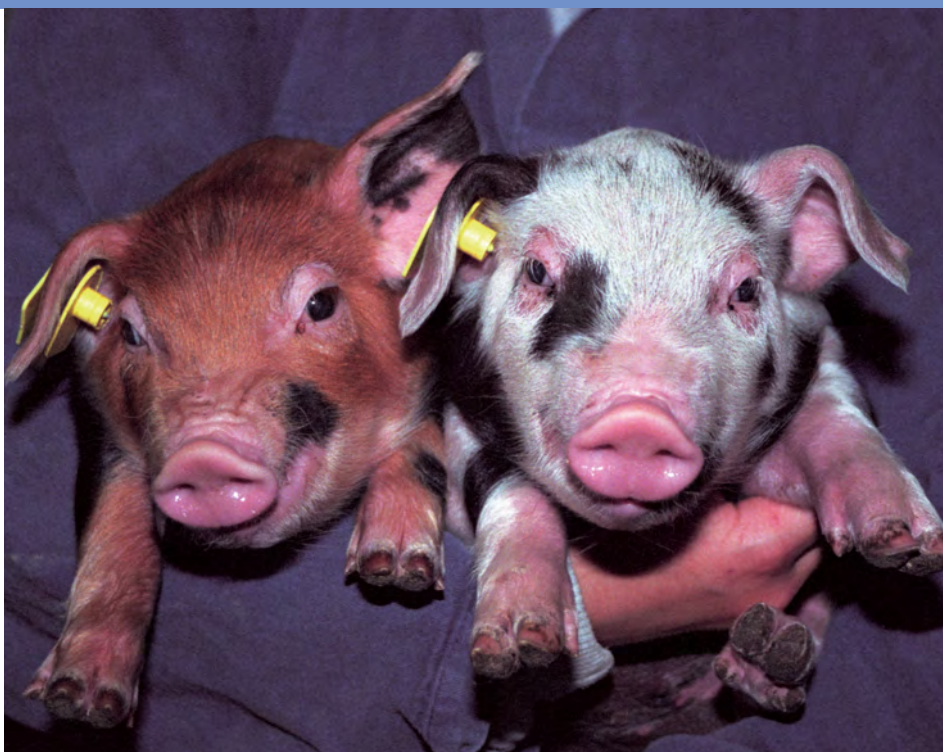
Piétrain-kruisingen hebben een hoger vleespercentage dan de Piétrain-vrije dieren

Een deel van de biologische vleesvarkens wordt als regulier vleesvarken afgezet, omdat ze te weinig spier (spierdikte 48 mm) en/of te veel spek (spekdikte ? 21 mm) hebben (uitbetalingssysteem vanaf november 2005). Dit is een grote verliespost voor biologische varkenshouders. Om dit probleem op te lossen zijn veel biologische varkenshouders overgegaan naar een Piétrain-eindbeer. In tabel 2 staan de productieresultaten van Piétrain-kruisingen en Piétrain-vrije dieren.