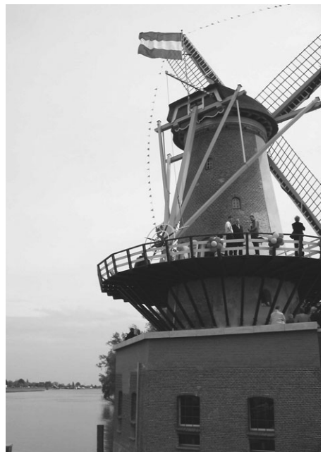
De vlag in top tijdens de feestelijkheden rond de opening van de gerestaureerde molen Windlust.

Op 20 mei heeft Lennie Huizer, gedeputeerde Zorg van de provincie Zuid-Holland, de gerestaureerde molen Windlust in Nieuwerkerk aan den IJssel officieel geopend. De korenmolens is rechtgezet, opgehoogd en verplaatst en heeft zijn maalfunctie teruggekregen.