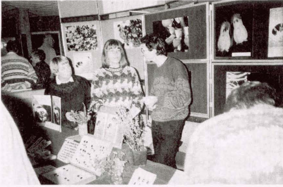
De stand van het Hommelprojekt

4 diversiteit na te streven. De specifieke wensen van veel solitaire bijen komen dan beter aan bod. De mogelijkheden om nestgelegenheid voor de wilde bijen in de eigen omgeving te scheppen, kwam ook uitgebreid aan de orde.