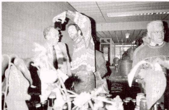
Heeft de jury haar werk goed gedaan?

Ambrosiushoeve kreeg hij van de voorzitter van de Bond een bos bloemen aangeboden.