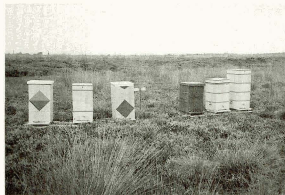
Bijen op de eindeloze heide van het Hoogveen Reservaat 'Bargerveen' bij Klazienaveen (Dr.).

Niet alle 'vroeg' heidegangers, die hun zomerhoning voor hun vertrek met succes hadden geoogst,