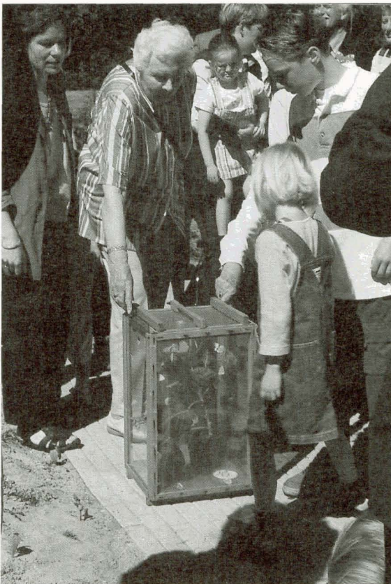
Veel belangstelling bij de opening van de vlindertuin