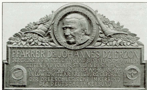
Gedenksteen op het huis in Lowkowitz

Auteur: Klaus Nowottnick, Ortsstr. 32, D-98593 Kleinschalkalden, Germany. E-mail: info@klaus-nowottnick-web.de