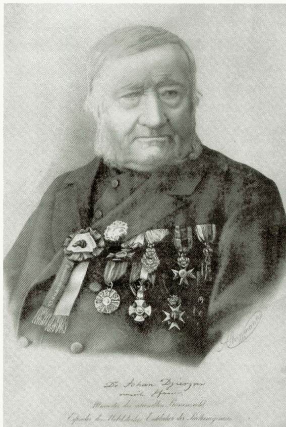
Dzierzon op 84-jarige leeftijd

Gedurende zijn leven zijn Dzierzon veel onderscheidingen ten deel gevallen. Tijdens een bijteeltcongres in Darmstadt kreeg hij b.v. de Ludwigsorde opgespeld. Erg trots was hij op zijn benoeming in 1858 tot erelid van de keizerlijke landbouworganisatie door Aarts-hertog Johann van Oostenrijk. In 1872 ontving hij een eredoctoraat van de universiteit van München. Op 90-jarige leeftijd kreeg hij van de Duitse keizer de