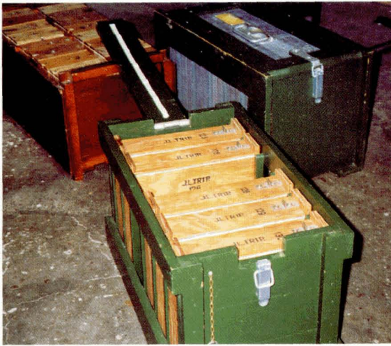
Transportkistje voor zes EWK's