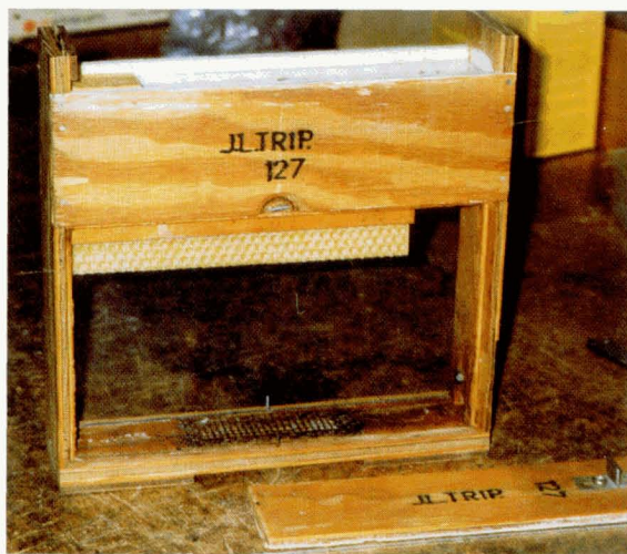
Het -1/3 normaal - EWK

De uitgangssituatie: je hebt de EWK's - van alles voorzien - klaarstaan; je hebt de benodigde jonge bijen (zonder darren) in een emmer/ton afgeslagen en natgemaakt; de onbevruchte koninginnen bevinden zich (opgesloten) in de nabijheid. Je legt de EWK's aan één zijde open (het ruitje eraf) naast elkaar; je doet daar met een schepje (100 à 120 cc. voor het 1/3