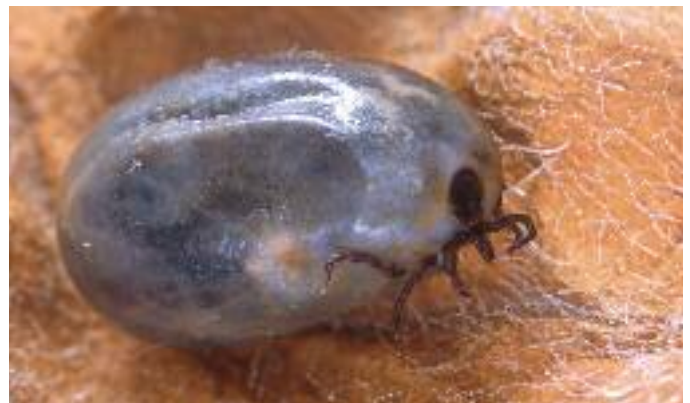
Een volgezogen teek

overal vastbijten. Ook op de benen worden ze vaak gevonden. Het is belangrijk goed te kijken, want nimfen (stadium tussen larve en volwassen teek) zijn slechts 1-1,5 mm groot en je ziet ze makkelijk aan voor bijvoorbeeld een moedervlek. Speciale tip: controleer de randjes van het ondergoed.