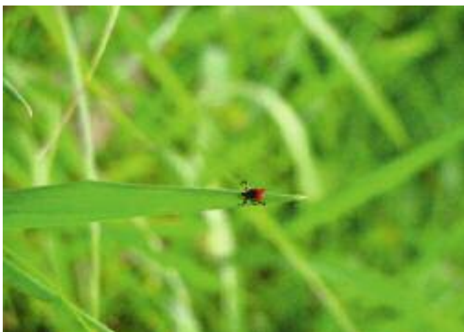
Teek op grasshalm