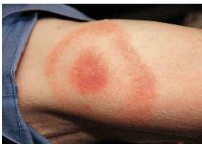
Erythema migrans, de zich uitbreidende rode ring