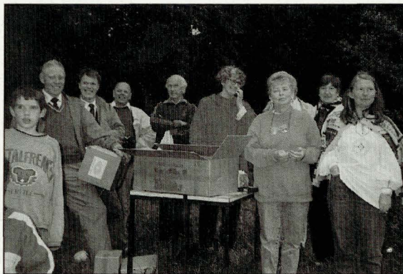
De Zweedse imkers "pakken uit"