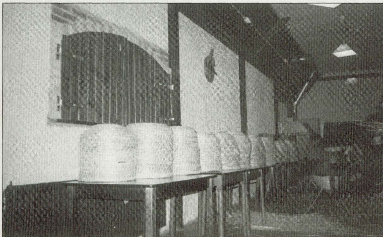
De oogst van de cursus korfvlechten