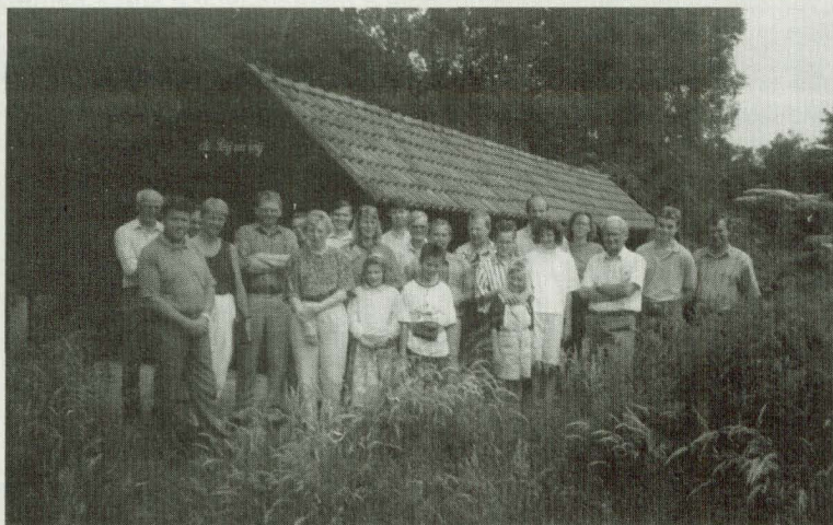
Edese bijenhoudersvereniging bij de bijenstal 'De bij en wij'.