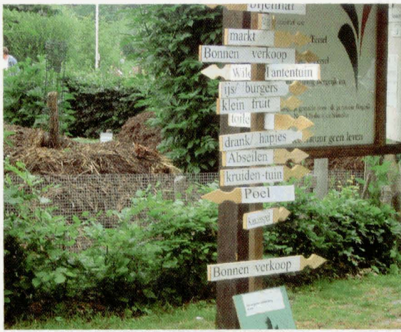
Hier staat het allemaal op.