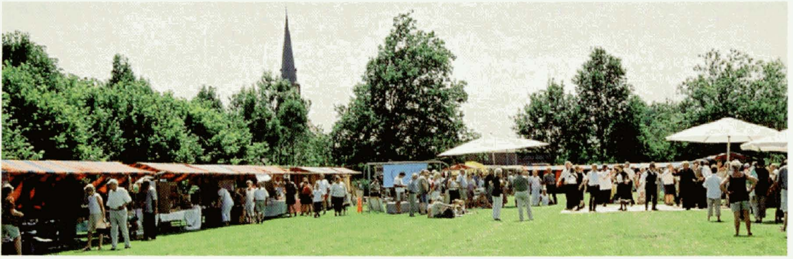
De Kempische Natuurmarkt viert dit jaar zijn eertse lustrum .