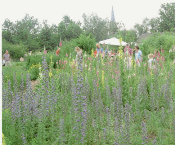
Wilder kan het bijna niet.

werden gebruikt als paardenwei en de voormalige kledruimte als paardenstal. De gemeente Bergeijk had overigens wel plannen met die plek, met name voor woningbouw. Maar een eigenwijze varkensboer in de directe omgeving weigerde te vertrekken of te verkopen. Dan heb je als gemeente rekening te houden met de zgn. stankcirkel, waarbinnen niet gebouwd mag worden. We hebben dus eigenlijk het ontstaan van Natuurtuin 't Loo te danken aan die boer en zijn koppigheid en aan zijn varkens en de door hen ontwikkelde 'stank'. De gemeente stelde dit braakliggende en niet te bebouwen terrein (16.000 m 2 groot) ter beschikking van onze drie verenigingen. Dat was koren op de molen van de secretaris van onze bijenvereniging in die dagen Tiny van Beek – met zijn tachtig jaar momenteel onze nestor. Omdat verschillende leden – na hun verhuizing naar een dichtbevolkte wijk – gestopt waren met imkeren, zocht Tiny energiek naar de mogelijkheid van een gezamenlijke bijenhal. Die mogelijkheid diende zich nu aan, althans wat de plek betrof. Maar daarmee beschik je nog niet over de middelen je plannen ook te concretiseren. We kregen de gouden tip een beroep te doen op de subsidiemogelijkheden bij de provincie Noord-Brabant. Die stelde wel allerlei eisen: stichtingsstatuten, een onderbouwd plan van actie met tekeningen, berekeningen en begrotingen. Met heel veel inzet en moeite kwam dat tenslotte voor elkaar. We konden op grond daarvan rekenen op een bijdrage van ruim f 200.000,-'.