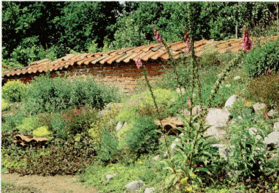
Niet zo maar een muur.