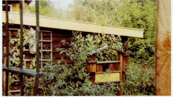
De afdeling solitaire bijen.