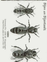
Bijen en Bijenteelt

Copyright © 2001 VBBN Nederland, uitgeverij 00171/0021/01