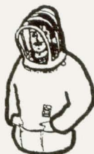
S36A Imkeroverall S/M/L wit of kaki f 290,00