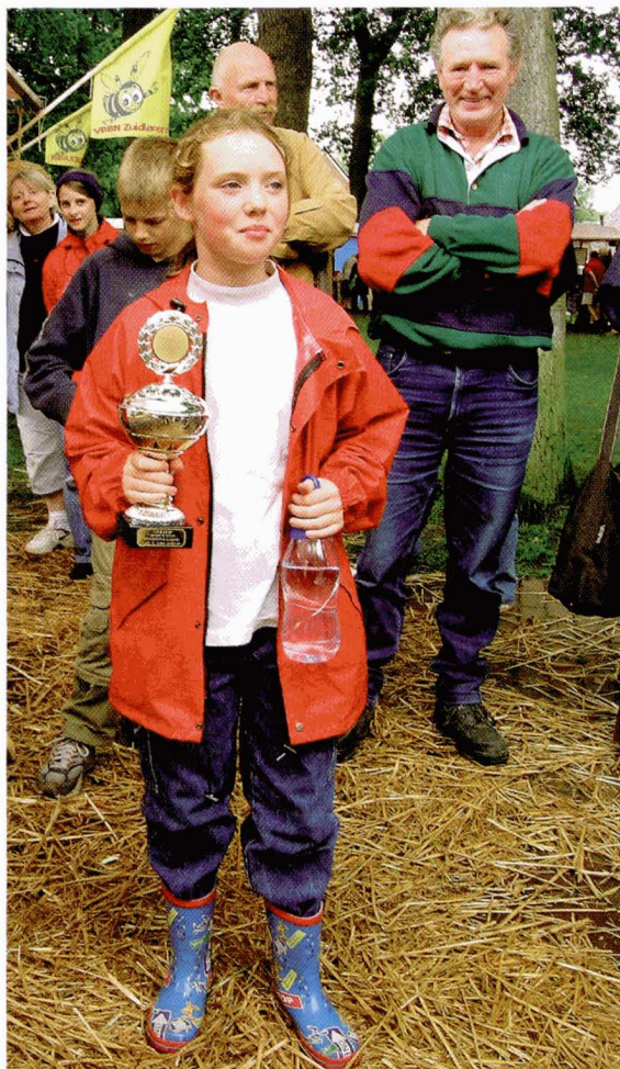
In de schaduw van grote keien zijn er altijd keitjes die door hun 'klein' zijn weinig aandacht krijgen, totdat zij zelf de aandacht opeisen.

imker). 's Avonds gebracht, volgende dag telefoon. Boer gestoken, kast verplaatst naar de rand van een weiland van dezelfde boer. De koeien durfden niet bij de drinkbak. Een braak liggend stukje grond bracht rust in de tent. Toen ik met de cursus begon heb ik gezegd genoeg te hebben aan hooguit enkele volken. Ik beloofde mijn vrouw met het imkeren te stoppen wanneer de bijen te veel van mijn vrije tijd zouden vergen en er geen tijd zou overblijven voor andere leuke dingen. Gerrit zorgde voor een tweede carnica-volkje en de twee volken werden er drie. Extra materiaal werd aangeschaft, maar dat was binnen de kortste keren allemaal in gebruik. Zeven volken. Nieuw (reserve)materiaal aangeschaft, vijftien volken. Vanaf toen geen reservemateriaal meer aangeschaft. Inmiddels gaat de jaarlijkse reis naar koolzaad en heide, gaan we er zomers maar enkele dagen op uit en de vakantie wordt in de winter gepland'. Herkenbaar toch?