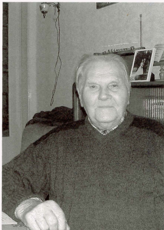
Reizen, zoals nu naar de wilg of naar het fruit, nee, dat deden we niet. Er waren langs de sloot en de weg ook veel meer gemengde bloemen.

Als voer kregen bijen vaste suiker. Van grote stukken - je kocht ze voor een dubbeltje per kilo - moest je een