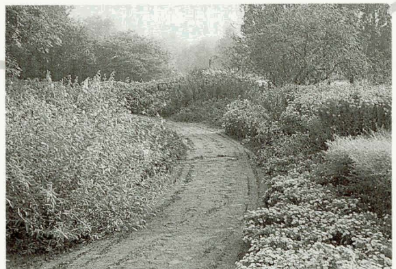
Tijdens de Open Dag staan in de vaste plantenborder veel planten in bloei.