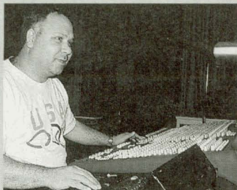
De opname en de techniek waren in goede handen bij SIMREK in Veenendaal.

'smoker' wordt genoemd, en er zijn meer soms onbegrijpelijke, buitenlandstalige vaktermen. Het geeft je een goed gevoel dat wij als VBBN toch maar in staat zijn om een dergelijke zeer goede en educatieve CD-rom te maken. Wij zijn dan ook zeer benieuwd naar de reacties in het buitenland. Wij hebben ze, natuurlijk, hier en daar al wat getest en met niet al te negatief resultaat. Wij zijn dus hoopvol gestemd. Voor het inspreken van de bewegende filmpjes hebben wij professionele stemmen ingehuurd, die dus prima klinken en door Freck Visser keurig in de filmpjes zijn gemonteerd.