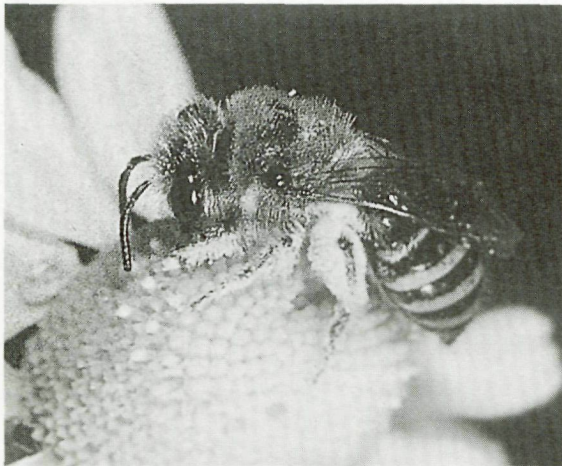
Een zijdebij ( Colletes sp.) op echte kamille. De meeste zijdebijen zijn in hun stuifmeelvoorziening zeer kieskeurig.

In het laatste hoofdstuk wordt diep ingegaan op een van de grootste en fraaiste wespesoorten in Europa nl. de hoornaar (Hornissen). Er is geen insect, waarover zoveel hardnekkige vooroordelen in omloop zijn. Zo zouden zeven hoornaars een paard kunnen doden, drie een volwassen mens en twee een kind! Is dit beeld juist? Volgens de auteurs is gebleken na onderzoek, dat het hoornaarsgif niet wezenlijk verschilt in toxiciteit en hoeveelheid in vergelijking met bijen- en wespengif. Een muis weerstond zonder gevolgen zes steken en een rat zelfs zestig zonder blijvende gevolgen! Waar komt die angst nu vandaan? Waarschijnlijk door de grootte, een koningin van vier centimeter zonder de uitsteeksels een flink beest. Bovendien zijn ze erg luidruchtig. Recente ervaringen hebben geleerd, dat het heel vreedzame beesten zijn, waarvan het nest (100-300 inwoners) zonder bezwaar tot op een meter te benaderen is. De onverwachte aanvallen bij onweersdreiging of sterke parfum- of zweetluchtjes waar onze bijen op reageren, is de hoornaars geheel vreemd. De spijskaart van een hoornaarsvolk is