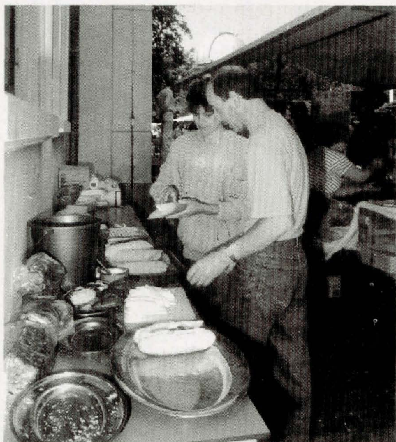
Ook voor de inwendige mens wordt gezorgd

176 'Hij heeft onze vereniging indertijd een enorme duw