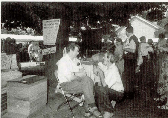
Een schaduwwijk rustpunt op de bijenmarkt

Het na afloop gezamenlijk uit eten gaan hebben ze afgeschaft. 'Aan het einde van zo'n lange, drukke dag, nadat alles, tot en met de laatste papiertjes, alles is opgeruimd is iedereen eigenlijk zo moe, dat we liever naar huis gaan.' Onvermoeibaar echter organiseert imkersvereniging 'Leiden e.o.' dit jaar toch weer hun groots opgezette bijen- en milieumarkt. Aan de vooravond van deze twintigste 'blij bijenmarkt' in successie een gesprek met enkele vertegenwoordigers van de marktcommissie'.