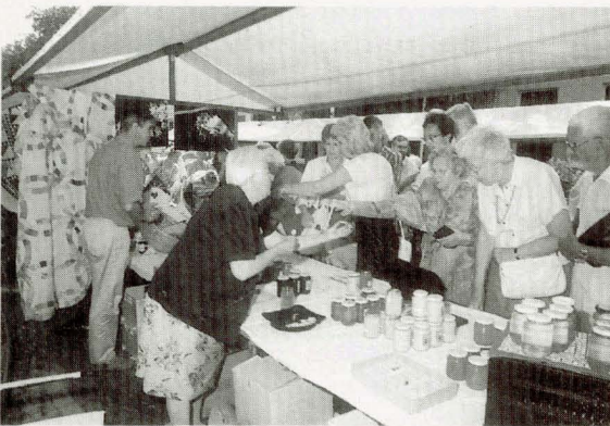
Voorlichting over lokale honing, proeven mag