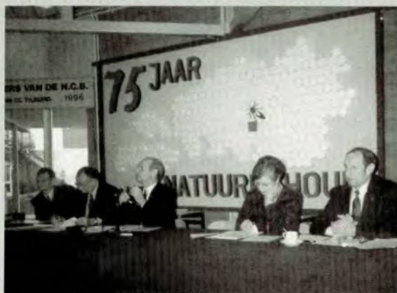
Het voltallige bestuur met het jubileumbord.

De vereniging Udenhout was overtuigd van het nut van de Ambrosiushoeve en vond dat de f10,- er moest komen. Wel wenste men een betere PR van de Ambrosiushoeve.