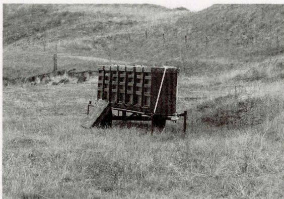
Reizen naar de lamsloor op Texel.

Hiervoor is kennis van drachtplanten en ervaring nodig om mogelijke drachtbronnen goed in te schatten. De weersomstandigheden zijn ook belangrijk; zo is het niet zinvol om naar de heidedracht te reizen als het erg droog is. In de afgelopen jaren was de koolzaaddracht in de Flevopolder een gemakkelijke en zekere dracht en was het eenvoudig om in het voorjaar koolzaadhoning te winnen. Een alternatief voor de vroege voorjaarsdracht kunnen wellicht de grienden zijn. Vooral op plaatsen waar veel verschillende soorten wilgen groeien kunnen vaak goede honingopbrengsten gehaald worden.