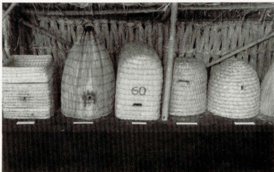
Een gezellige ouderwetse stal in de expositieruimte van het Bijenhuis.