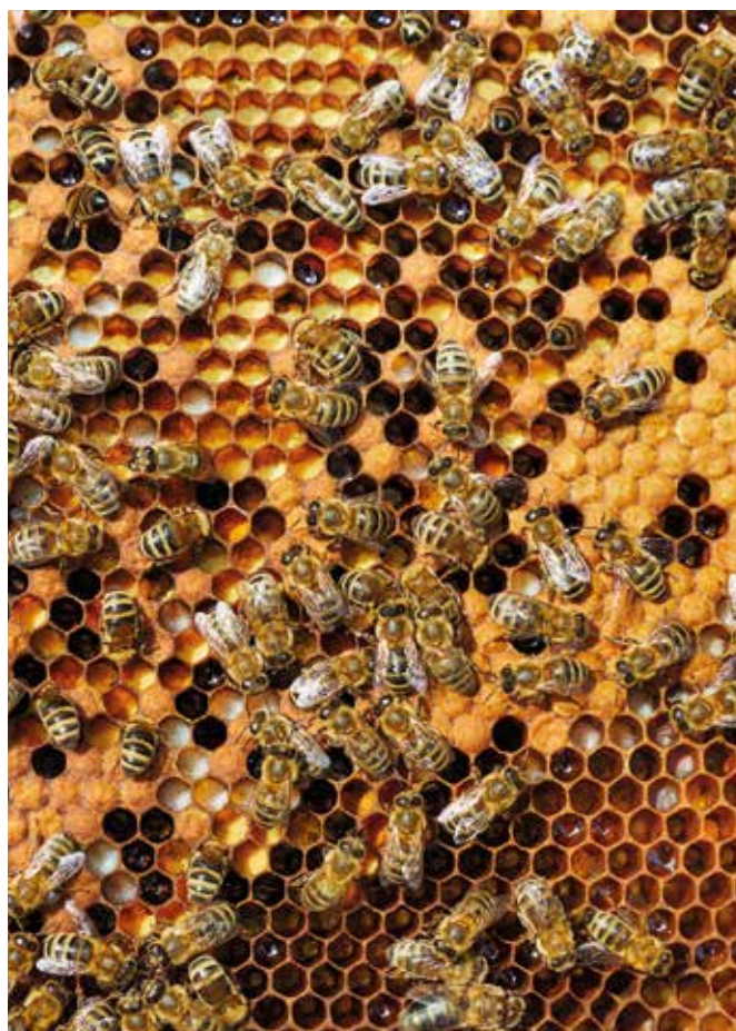
Carnicabijen met open en gesloten broed.