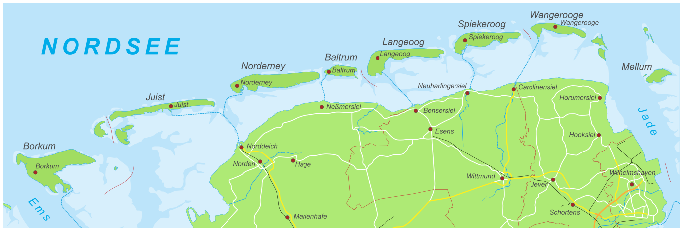
Duitse Waddeneilanden. Illustratie ii-graphics

Veel imkers denken bij lijnen vooral aan de moederkant: de moeder van de moeder enzovoort van een koningin. Daarom hebben we van moederkant in de Beebreed-data-bank voor elke koningin op de bevruchtingseilanden van de afgelopen negen jaar de oudste moeder zonder bekende voorouders opgezocht; we noemen die koningin stammoeder. Darren zijn echter erfelijk gezien even belangrijk als de koningin en daarom hebben we de stammoeders niet alleen voor de moederkant opgezocht, maar ook voor de vaderkant. In totaal hebben we per eilandkoningin de stammoeders opgezocht van alle acht overgrootouders. Vervolgens hebben we de stammoeders per lijn op een rijtje gezet. Daartoe hebben we Troiseck 07 en 1075 samengenomen maar wel Troiseck Hoffmann apart gehouden. Wanneer stammoeders duidelijk verschillen tussen de lijnen dan kan je zeggen dat die lijnen erfelijk verschillen. Verschillen de stammoeders niet erg, dan zijn de lijnen kennelijk behoorlijk gemengd. Het kijken naar de bevruchtingseilanden geeft een goede indruk van de situatie in de bijenteelt heden ten