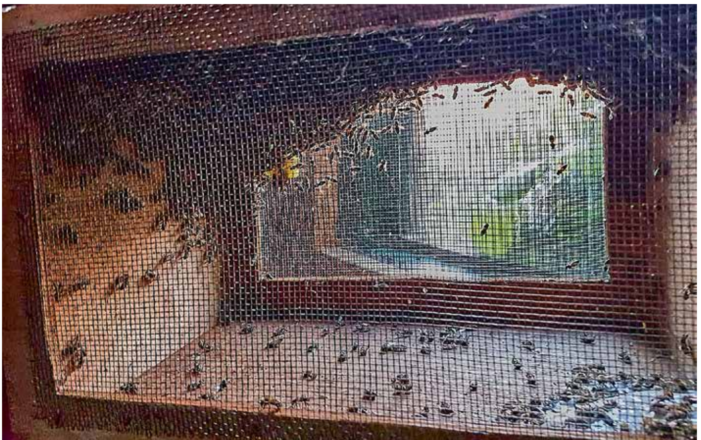
Foto 1. Linksboven hangt het uitlopkooitje tegen het gaas.

We geven in dit artikel eerst een beschrijving van de openkooimethode en vervolgens van de manier om koninginnen in een groot volk in te voeren.