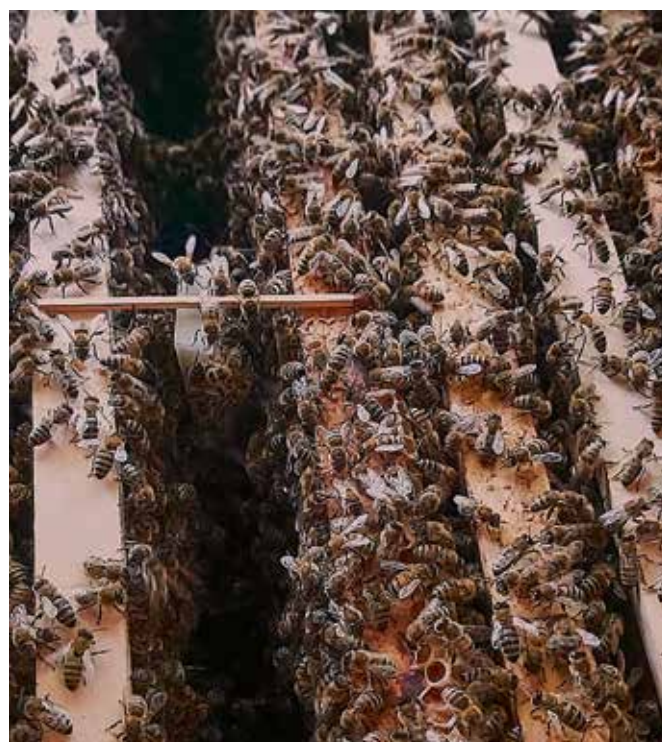
Foto 6. Nicot-invoerkooitje hangt tussen twee raampjes.