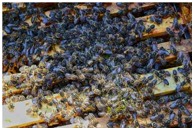
Foto 5. De bijen groeperen zich massaal rond het invoerkooitje. U kunt twee ramen wat uit elkaar schuiven en daar het kooitje tussen hangen of erboven een dekplank met dikkere latjes leggen om meer ruimte te creëren tussen de plank en de ramen, leggen zodat u na twee uur kunt controleren of de bijen rond de koningin zitten.