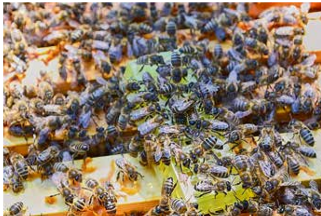
Foto 4. Bijen signaleren de aanwezigheid van een nieuwe koningin en beginnen te stertselen.