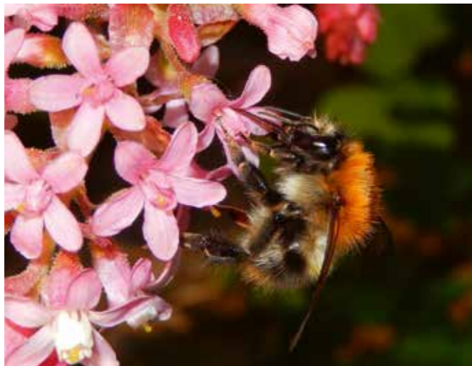
Akkerhommel heeft als volwassen bevruchte koningin overwinterd in een zelfgegraven holletje of tussen kruiden.

In warme, droge landen komt het fenomeen overliggen vaker voor, vooral in heel droge gebieden. Dat gebeurt niet alleen bij bijen maar ook bij vlinders. 🍯