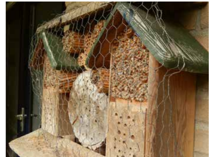
Het bijenhotel met rietstengels in de winter.