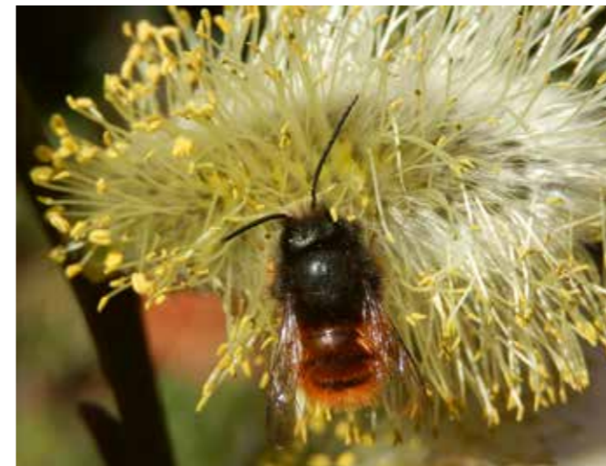
Mannetje gehoornde metselbij na overwintering als volwassen bij in cocon.