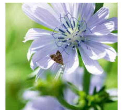
Chichorei met brandnetelmotje.

Sinds 2018 is de NBV begonnen met het opleiden van Ambassadeurs Biodiversiteit. Deze ambassadeurs hebben een gedegen opleiding gekregen waarin vele aspecten van het verbeteren van de leefomgeving van bestuivers aan bod is gekomen. Heeft u hulp nodig bij een project om de leefomgeving van bestuivers te verbeteren, neem dan contact op met een ambassadeur biodiversiteit in uw omgeving. Meer informatie hierover kunt u vinden op de website van de NBV.