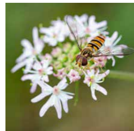
Snorzweefvlieg op Berenklauw.