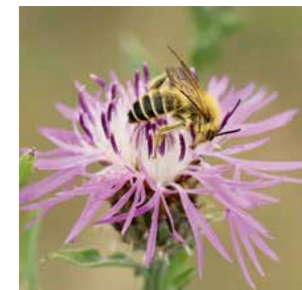
Pluimvoetbij op distel.