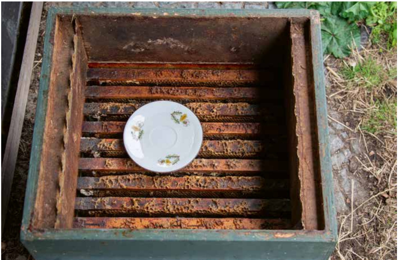
Raampjes met ijsazijn

moeten worden opgeslagen. Neem een reservekast met een open gaasbodem, stapel nu de bakken met ramen op elkaar en leg de dekplank en het deksel erop. Zo ontstaat er een toren van uitgebouwde ramen met een goede ventilatie. Zorg ervoor dat het vlieggat dicht zit, zodat muizen en wasmotten er niet bij kunnen. IJsazijn in een schoteltje bovenop de ramen doodt eventuele eieren en larven van de wasmot die in de ramen zouden kunnen zitten. Ook hier geldt; vocht is onze vijand. Kunt u de toren in de schuur (bijenstal) of onder de carport zetten dan is dat beter.