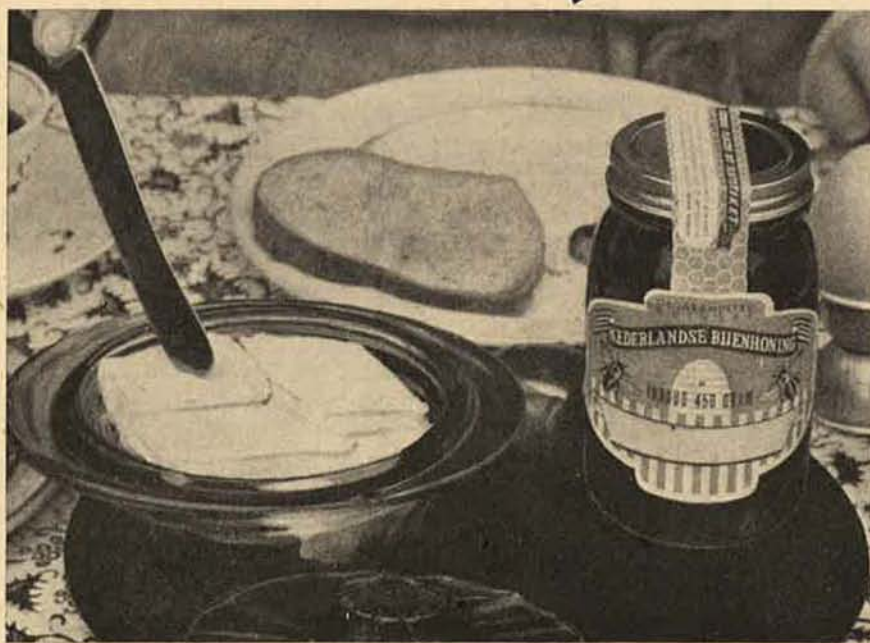
Honing in een pot van helder wit glas en voorzien van een net, roestvrij deksel en een aantrekkelijk etiket „oogt” veel beter.

De volgende keer iets over de behandeling van raathoning. S.