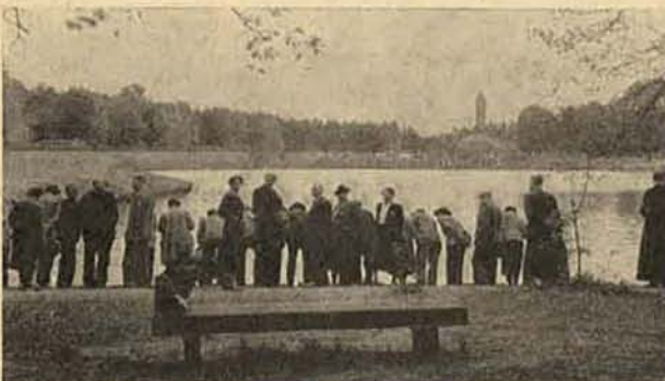
Een groep Belgische imkeressen en imkers bezocht „Ambrosius-hoeve”, het Bijenhuis te Wageningen, het jachtslot „Sint Hubertus” en het Openluchtmuseum te Arnhem. Op de Hoge Veluwe zagen ze herten van zeer nabij en op de foto blijkt hun belangstelling voor de karpers in de vijver van St. Hubertus!

Op de bovenste foto de deelnemers op de binnenplaats van het slot.