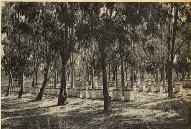
.... een flinke bijenstand onder eucalyptus-bomen ....