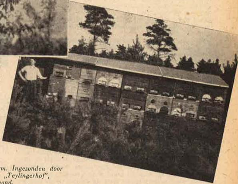
1. Boven: Bijenzwerm.

3. Onder: Bijenstal.