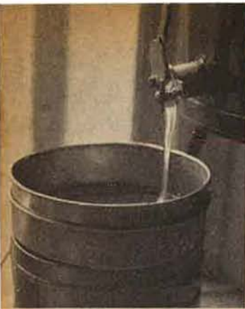
Boven: Men gebruikt bij voorkeur een dubbele zeef, eerst een grove en daaronder een fijne. De honing, welke die twee zeven gepasseerd is, is al tamelijk zuiver.

Bij het aftappen houde men de flacons of ander vaatwerk vlak onder de kraan en late de honing tegen de opstaande wand van de flacon lopen (liever niet direct op de bodem, om zo weinig mogelijk lucht in de honing te krijgen). Voor alle zekerheid worden de flacons of de bussen aanvankelijk losjes gesloten en na een of twee dagen nagezien, of er zich toch nog enig schuim gevormd heeft. Dit kan dan met een lepeltje voorzichtig worden afgeschept. Daarna worden de vaten definitief gesloten en wel luchtdicht. Honing is nl. hygroscopisch, d.w.z. dat hij vocht aantrekt. Sluit men de vaten niet luchtdicht af, dan trekt de honing vocht uit de lucht aan, wordt dun en gaat spoedig gisten. De deksels van het vaatwerk behoren dus zó te zijn ingericht, dat deze