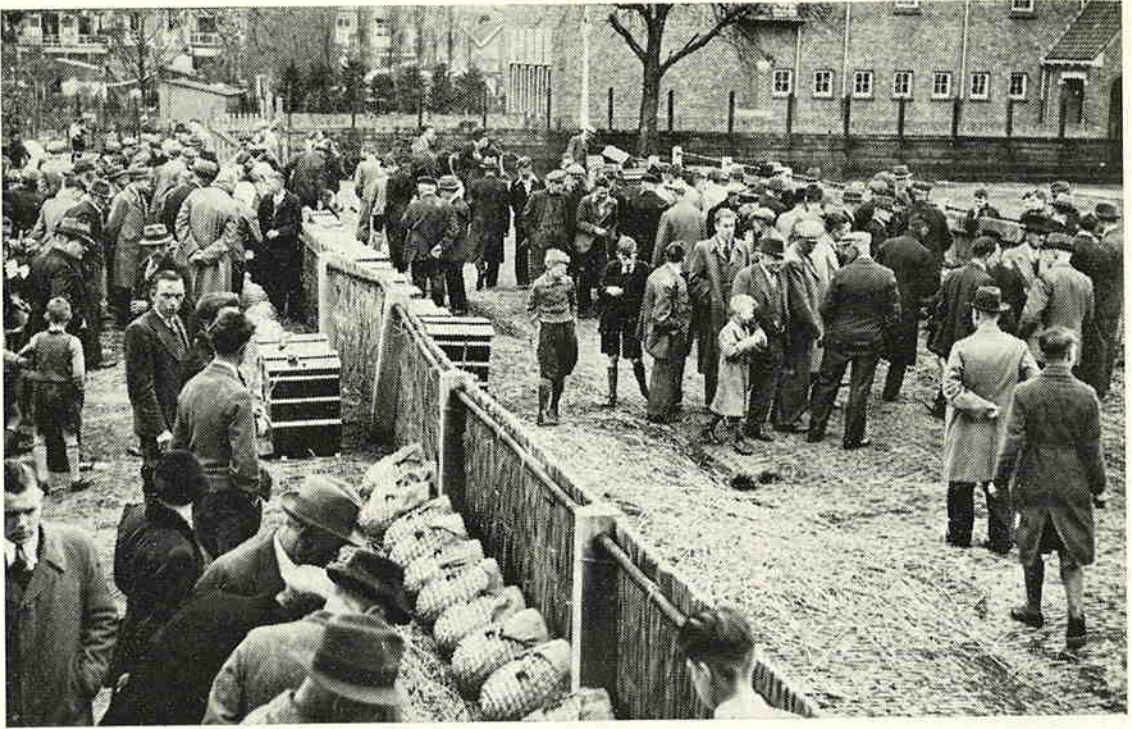
De eerste Dordtse markt in 1939.