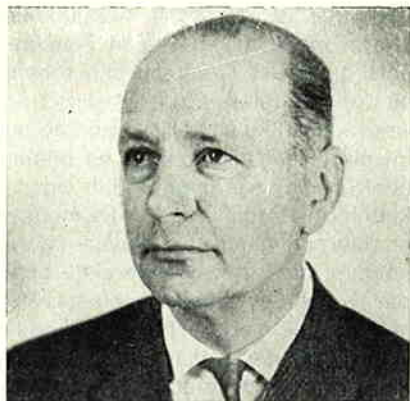
Ha die Willem . . .

Er waren wat onaangenaamheden over de schrijverij van Willem, waarop hij de aloude stelling „minder arbeid, groter gemak”, toepaste en het bijtje erbij neerlegde. Anderzijds zijn er ook weer tekenen van belangstelling, dus vooruit dan maar weer, maar voorlopig wel op een andere toer. Naar de mening van Willem — om deze vertrouwde schuilnaam, die zo langzamerhand geen schuilnaam meer is, toch maar te handhaven — ontbreekt er nog wel wat aan de communicatie tussen hoofdbestuur en afdelingen, wat op de laatste algemene vergadering z.i. weer duidelijk is gebleken. Hij kan zich niet onttrekken aan de indruk dat lang niet alle afgevaardigden de inhoud van statuten en huishoudelijk reglement voldoende kennen, wat in de discussie aanleiding geeft tot tegenstellingen die er niet behoeven te zijn. Het gevolg is dat een afwijzende houding van het H.B. — het is een veel gemaakte fout daar de voorzitter op aan te zien, deze fungeert alleen als spreker namens het H.B. — wordt aangevoeld als onwil, terwijl dit in feite dan een gevolg is van hetgeen statutair is voorgeschreven.