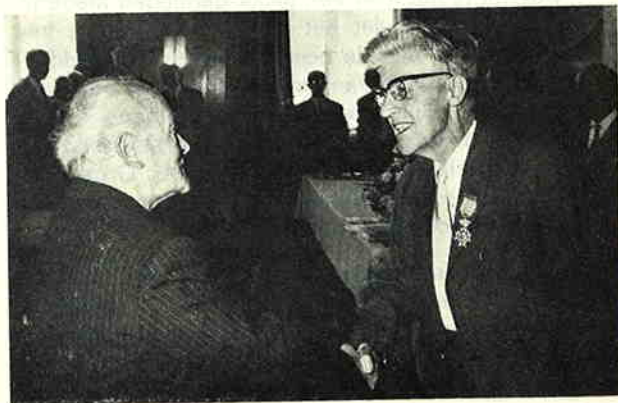
Foto III. De welgemeende gelukwens van de loco-burgemeester.