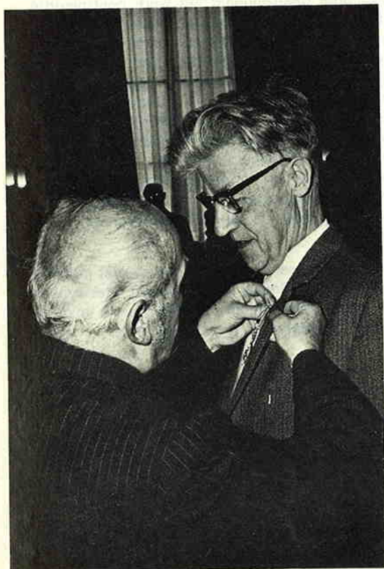
Foto II. De loco-burgemeester speldt onze scheidende functionaris de versierselen van Ridder in de Orde van Oranje-Nassau op.