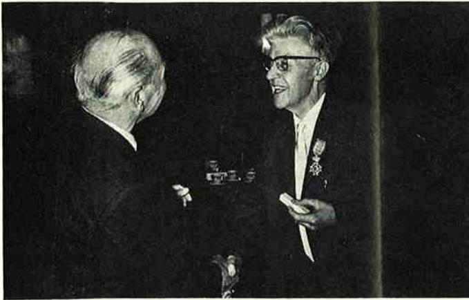
Foto IV. De voorzitter biedt als persoonlijk geschenk de draaginsignes, bij de Ridderorde behorende, aan.