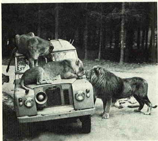
De voerauto wordt overvallen

H.B. openstaat voor opbouwende kritiek en de vereniging zal verdedigen tot het uiterste. Loco-burgemeester v. d. Grijn, zelf oud-imker en stellig van plan de bijenhouderij het komende seizoen weer op te vatten, gaf ons een overzicht van de historische groei en huidige ontwikkeling van Doetinchem en vertelde op smeugige wijze enkele ervaringen uit zijn imkersloopbaan, waarbij het verhaal, hoe een boer, die er beslist op stond, de werking van bijengif op zijn reumatische aandoeningen te proberen en die ten aanschouwe van veel publiek — de bijenvolken stonden op korte afstand van de weg — flink werd gestoken, wel het hoogtepunt vormde. Hij ging er, reumatisch en wel, als een kievit vandoor maar er moest als resultaat van de „behandeling” wel een dokter aan te pas komen.