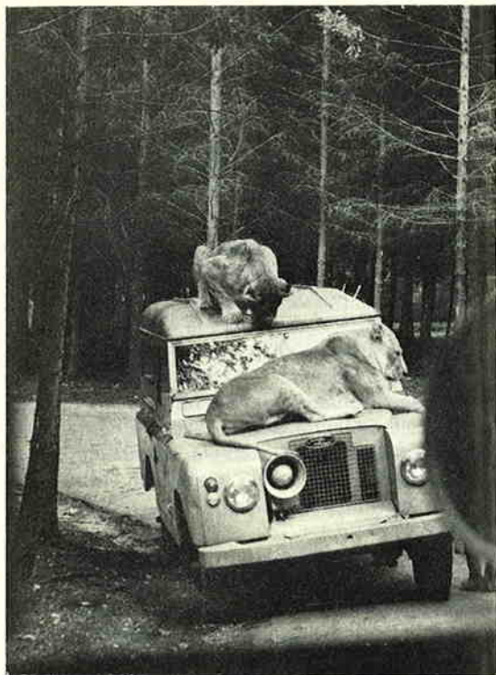
Door het portierraam van de bus