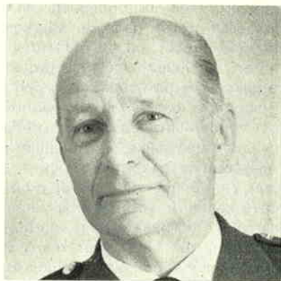
Ha die Willem . . .

We hebben in de laatste artikelen van deze serie de opbouw van de vaderlandse imkerij bekeken in het organisatorische vlak. We willen dit besluiten met een overzicht van hetgeen op internationaal terrein gebeurt.