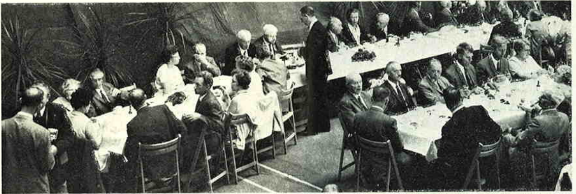
Tijdens de lunch