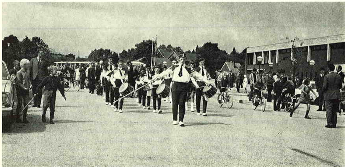
Op weg naar de koffietafel