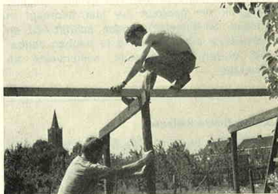
Op een snikhete dag in de bouwvakvakantie werd de afdelingsstal in Houten gebouwd. Er was een bus met koud bier en een opperbeste stemming!

Op de voorjaarsvergadering werden de plannen gesmeed en menig imker zal gedacht hebben: „Daar wordt zoveel over gepraat, 't gaat vast nog jaren duren voordat die stal er staat". Enkele Houtense leden zochten een terreintje, midden in de dorpskern, prachtig gelegen, en zorgden dat de toestemming van B. en W. spoedig afkwam. Van gemeentewerken kregen