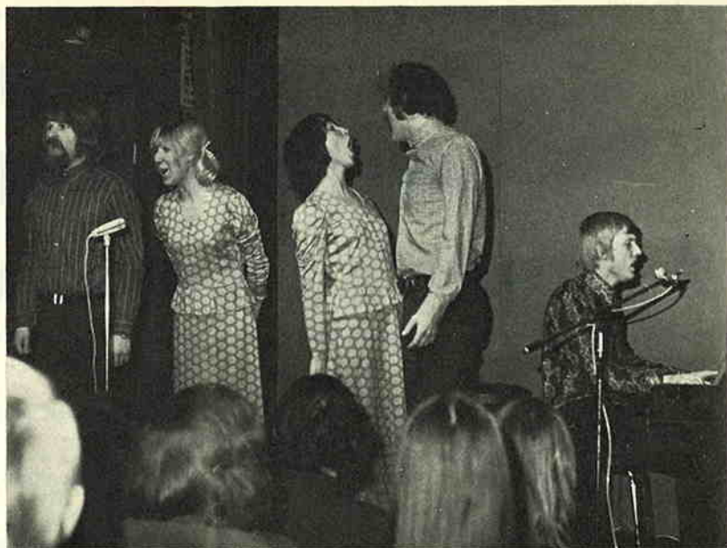
Onze cabarettroep in actie.

schema is daarvoor eenvoudigweg geen ruimte en bovendien heeft het laten vervallen van de gemeenschappelijke maaltijd het mede mogelijk gemaakt om tot de belachelijk lage deelnameprijs van f 5,50 per persoon te komen.