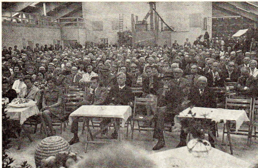
We hadden „een volle bak“.