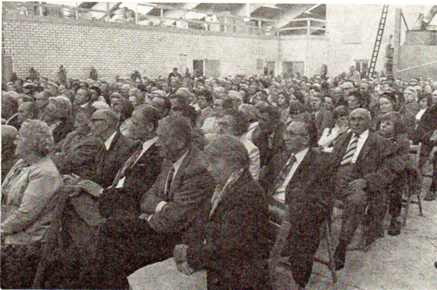
Geen stoel bleef onbezet.

Ook de andere genodigden werden met een warm woord begroet. Aanwezig waren o.a. Ir.