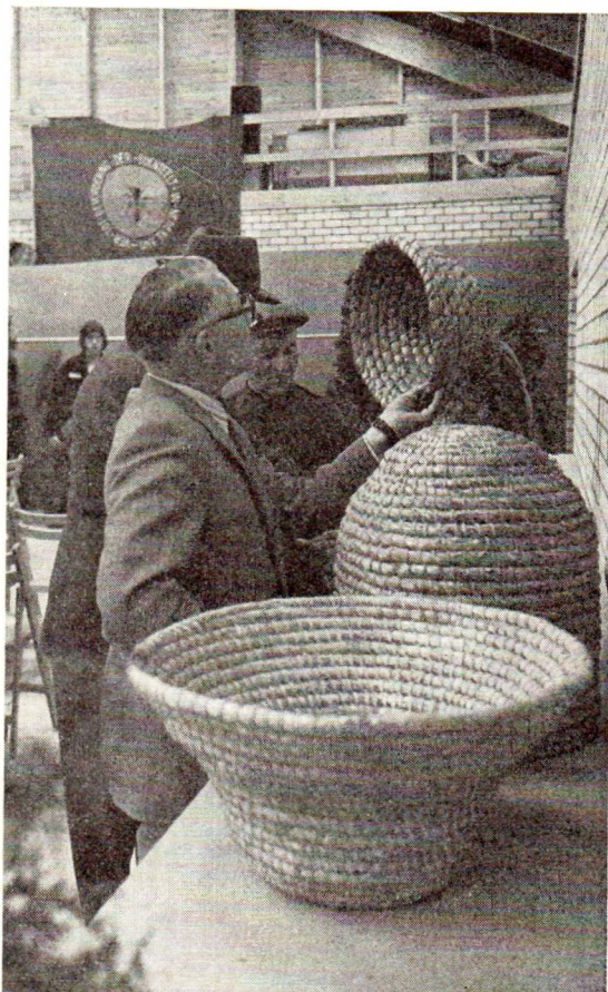
Kritische blik op het vlechtwerk

Namens de Commissie der Nationale Honingtentoonstelling C. Pater Jzn