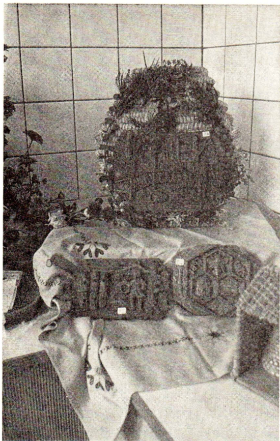
Een hoekje van de tentoonstelling